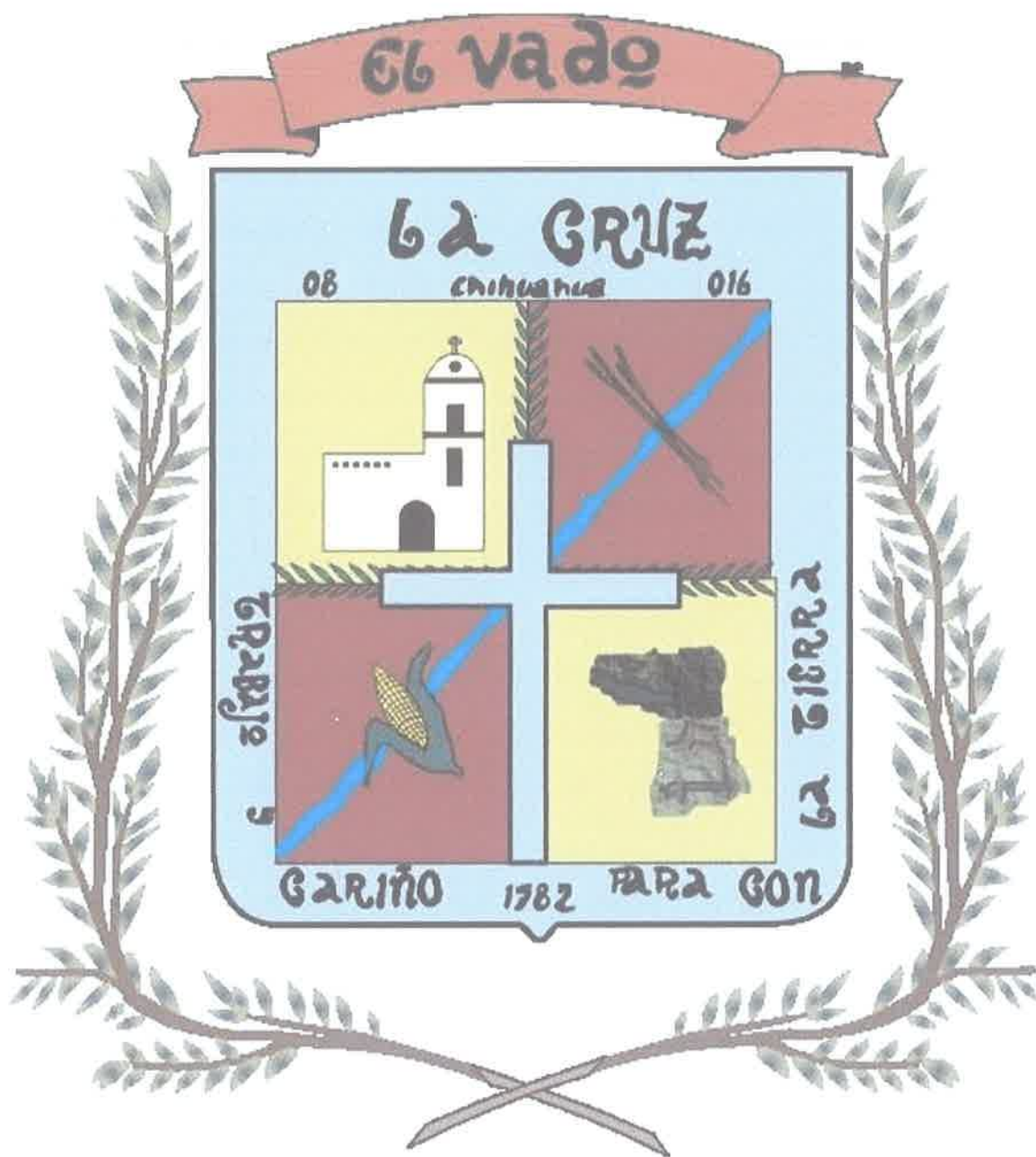
TABLA DE VALORES PARA EL EJERCICIO FISCAL 2022 UNITARIOS DE SUELO URBANO, CONSTRUCCIÓN Y DE SUELO RUSTICO.