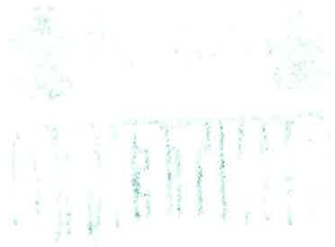
TABLA DE VALORES UNITARIOS DE SUELO Y CONSTRUCCIÓN EJERCICIO FISCAL 2022

MUNICIPIO DE JUÁREZ DEL ESTADO DE CHIHUAHUA