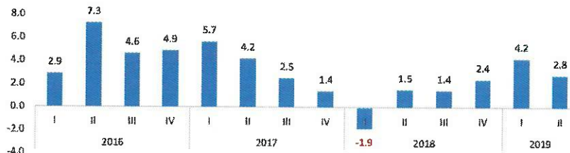
Indicador Trimestral de la Actividad Económica (Variación porcentual)