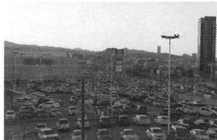
Fuente: Imagen de centro comercial, sin árboles en el área de estacionamiento

como islas de calor, las cuales corresponden a zonas que han sido urbanizadas con asfalto, concreto hidráulico así como vialidades, las cuales absorben cantidades considerables el calor que produce los rayos solares, más aún cuando hay concentración de automotores, ciudades del Estado de California en los Estados Unidos de América han implementado programas que puede generar una disminución entre 6 y 7 grados en las áreas conocidas como "islas del calor", para efectos ilustrativos se incorporan a la presente iniciativa con carácter decreto diversas fotografías de predios de tipo comercial considerables que se encuentran 100% urbanizadas y que sin duda al no contar con vegetación alguna traen un impacto negativo en el medio ambiente.