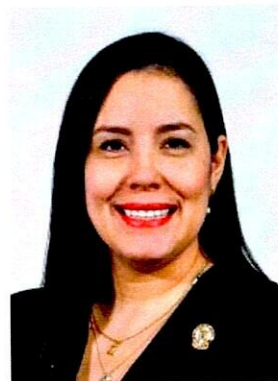
Dip. Joceline Vega Vargas Vocal Distrito XV. Chihuahua Partido Acción Nacional