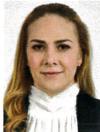
Diana Ivette Pereda Gutiérrez Presidenta Representación Proporcional Partido Acción Nacional