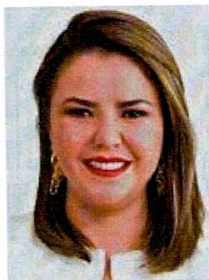
DIP. GEORGINA ALEJANDRA BUJANDA RÍOS