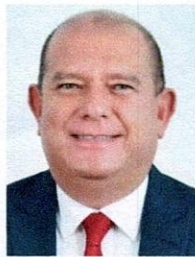
DIP. EDIN CUAHTEMOC ESTRADA SOTELO