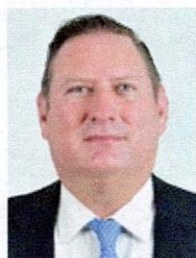
DIP. CARLOS ALFREDO OLSON SAN VICENTE Presidente