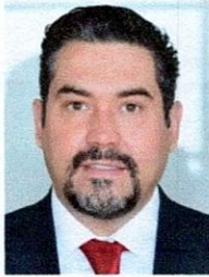
DIP. EDGAR JOSÉ PIÑÓN DOMÍNGUEZ