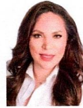
DIP. ANA GEORGINA ZAPATA LUCERO