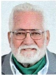
DIP. GUSTAVO DE LA ROSA HICKERSON