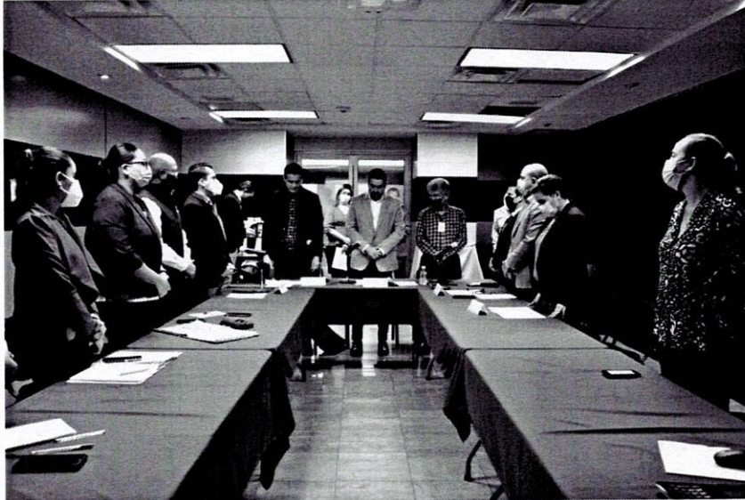
Instalación de la Comisión de Agua de la Sexagésima Séptima Legislatura.