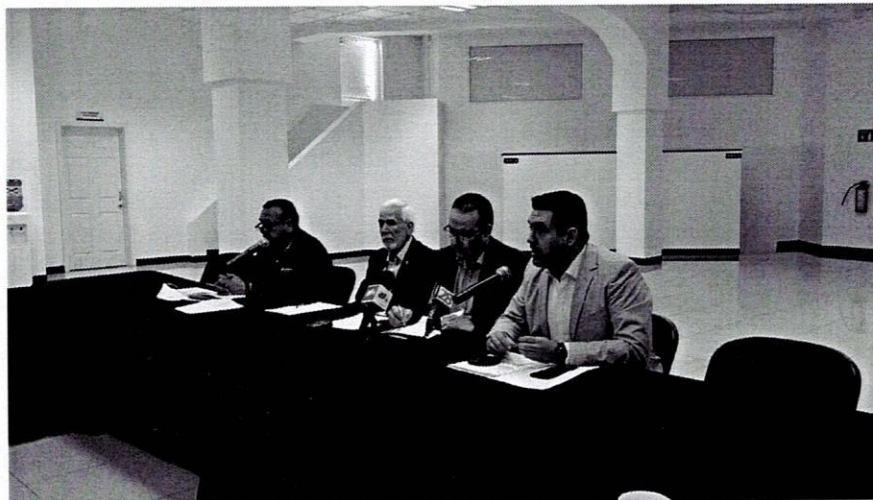
Rueda de Prensa en Ciudad Juárez.