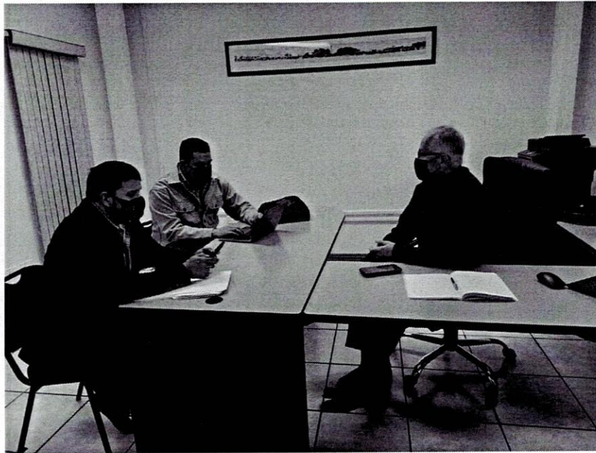
Visita de gestión en Conagua.