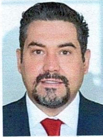
DIP. EDGAR JOSÉ PIÑÓN DOMÍNGUEZ Presidente Distrito XXI. Hidalgo del Parral Partido Revolucionario Institucional