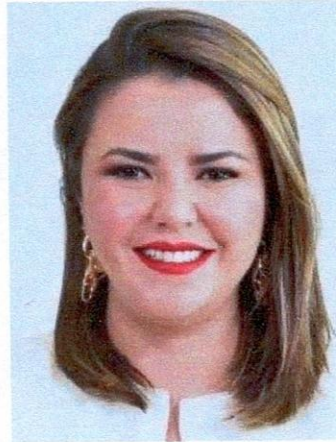
Georgina Alejandra Bujanda Ríos Presidenta Partido Acción Nacional