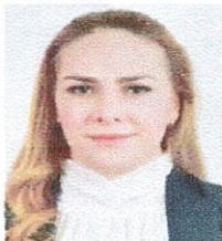
DIP. DIANA IVETTE PEREDA GUTIERREZ