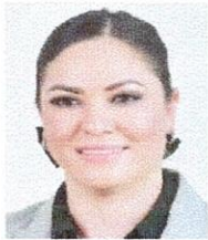
DIP. YESENIA GUADALUPE REYES CALZADÍAZ