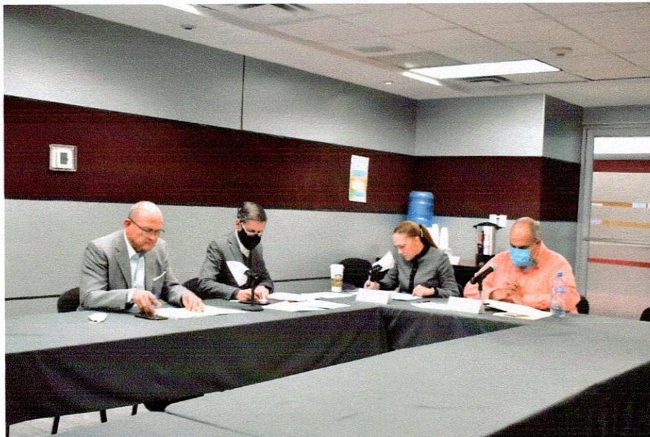
Explicación del contenido del dictamen que se somete a la consideración de los Diputados integrantes de la Comisión de Energía