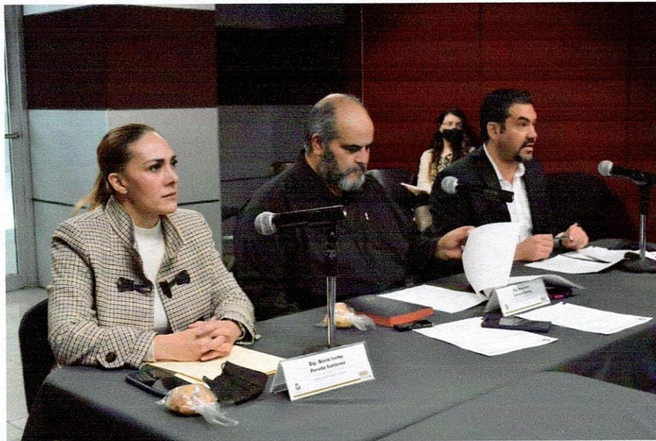
Instalación de la Comisión de Energía