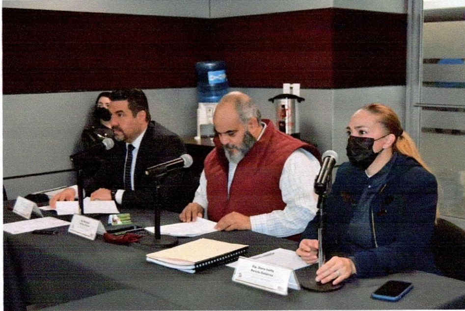
Análisis de los asuntos turnados a la Comisión de Energía