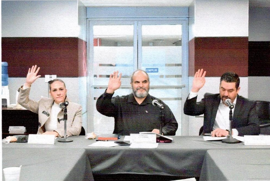
Aprobación del Programa de Trabajo de la Comisión de Energía