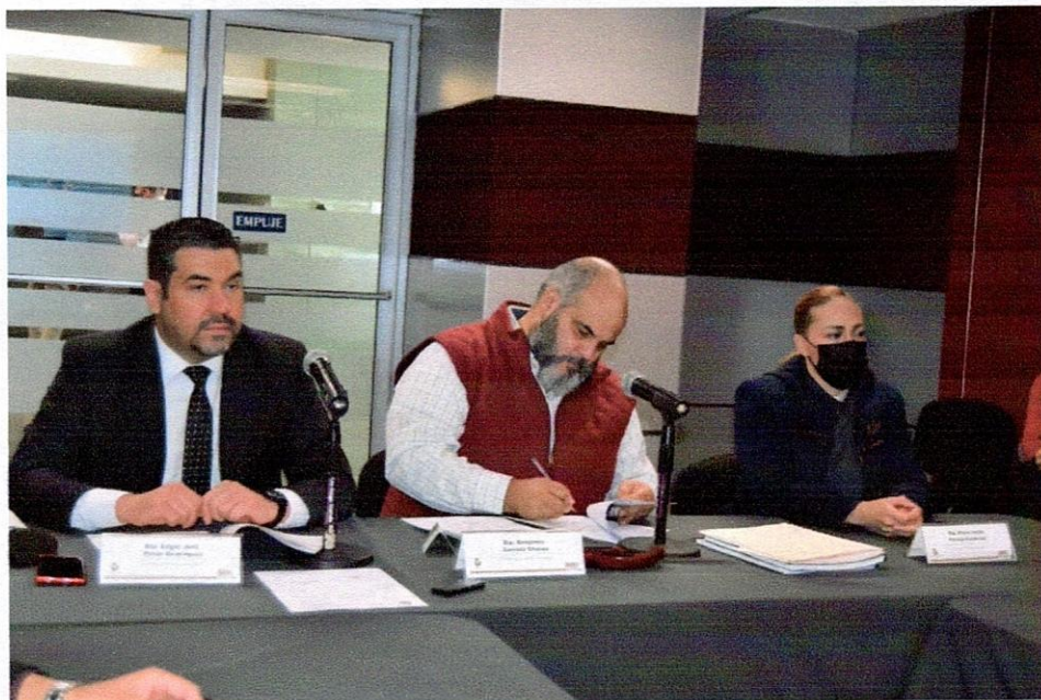
Reunión de la Comisión de Energía