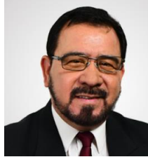
DIP. MIGUEL ÁNGEL COLUNGA MARTÍNEZ