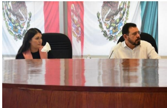
Nota: Reunión del día 05 agosto de 2020, en la sala Juntas de la Sala Morelos.

Respecto a la fiscalización de los estados financieros correspondiente a la Universidad Autónoma de Ciudad Juárez del ejercicio fiscal 2018, el cual se encontraba dictaminado en fecha 30 diciembre 2019, con una serie de operaciones detectadas por los integrantes de la Comisión Fiscalización, aprobándose modificaciones al proyecto de dictamen en reunión de fecha 20 julio 2021, persistiendo un pago injustificado por la cantidad de $150,800.00, el cual se aprobó por parte del Pleno en la sesión número 279 de fecha 30 agosto de 2021, LXVI Legislatura, III año, XIV PE.