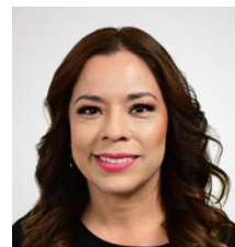
DIP. ROCIO GUADALUPE SARMIENTO RUFINO