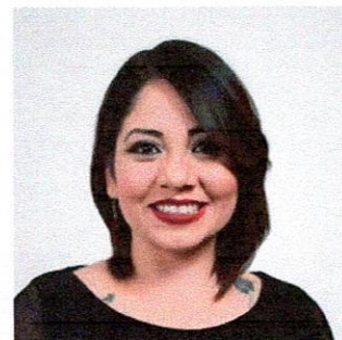
DIP. AMELIA DEYANIRA OZAETA DÍAZ