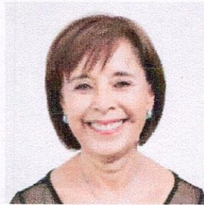
Blanca Gámez Gutiérrez Presidenta