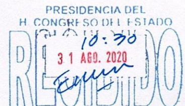
DIP. BLANCA GÁMEZ GUTIÉRREZ PRESIDENTA