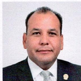
DIPUTADO OMAR BAZÁN FLORES VOCAL REPRESENTACIÓN PROPORCIONAL PARTIDO REVOLUCIONARIO INSTITUCIONAL