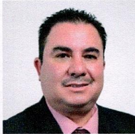
DIPUTADO LORENZO ARTURO PARGA AMADO VOCAL DISTRITO XXI HIDALGO DEL PARRAL MOVIMIENTO CIUDADANO