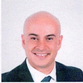
DIPUTADO MIGUEL FRANCISCO LA TORRE SÁENZ VOCAL DISTRITO XVI CHIHUAHUA PARTIDO ACCIÓN NACIONAL

"2020, Por un Nuevo Federalismo Fiscal, Justo y Equitativo" "2020, Año de la Sanidad Vegetal"