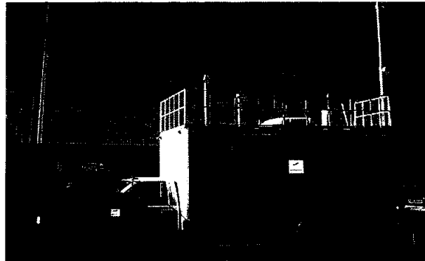
Dirección de Ecología, unidad móvil de Monitoreo Ambiental

Derivado de la revisión a este apartado se puede apreciar que la unidad móvil de monitoreo Ambiental se encuentra en el estacionamiento de la Dirección de Ecología, toda vez y por información de la misma dirección porque requiere mantenimiento el automotor y los equipos analizadores (actualización); por lo que con fundamento en el artículo 7 fracción XVIII, de la Ley de Auditoría Superior del Estado de Chihuahua, se recomienda dar el mantenimiento correspondiente al equipo y al vehículo con la finalidad de que cumpla con la función de monitorear el medio ambiente.